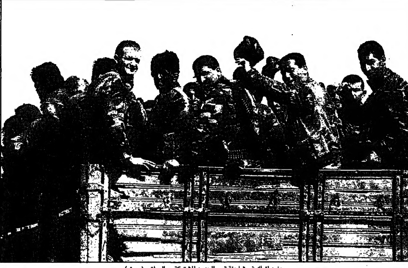
جنود اترك في شاحنة قرب الحدود المشتركة مع العراق

خدام اعلن قلقه من التوغل في «العراق الشقيق».. واعتبره دليل سوء نية انقرة